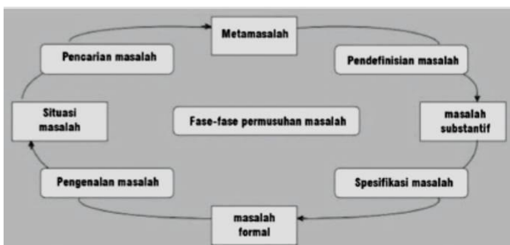
Gambar 1. 2 Fase Perumusan Masalah Kebijakan

dapat berakibat fatal. Untuk itu, tidak jarang banyak kebijakan publik yang pada akhirnya malah menyengsarakan dan bukan berpihak pada rakyat. Mengingat pentingnya fase ini, maka William Dunn menyebutkan setidaknya ada empat tahap dalam perumusan masalah, antara lain: problem search (pencarian masalah), problem definition (pendefinisian masalah), problem specification (menspesifikasi masalah), dan problem sensing (pengenalan masalah) (William N. Dunn, 1999:226). Berikut adalah fase perumusan masalah kebijakan.