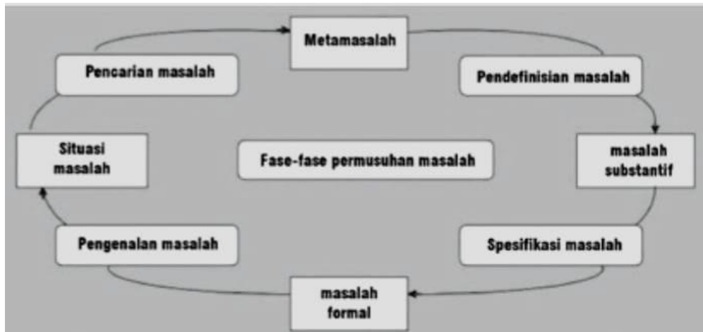
Gambar 1. 2 Fase Perumusan Masalah Kebijakan

pentingnya fase ini, maka William Dunn menyebutkan setidaknya ada empat tahap dalam perumusan masalah, antara lain: problem search (pencarian masalah), problem definition (pendefinisian masalah), problem specification (menspesifikasi masalah), dan problem sensing (pengenalan masalah) (William N. Dunn, 1999:226). Berikut adalah fase perumusan masalah kebijakan.